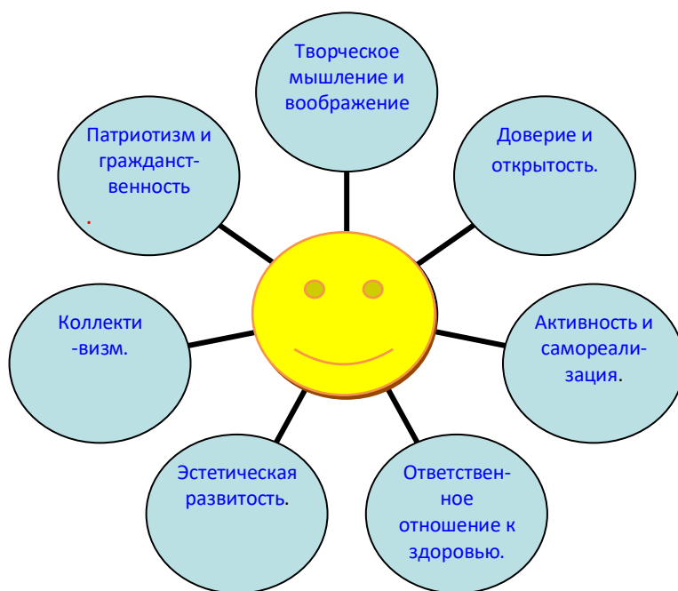
Рис. 1. Модель выпускника Дома детского творчества.

С учетом социального заказа педагогический коллектив Дома детского творчества разработал модель выпускника.