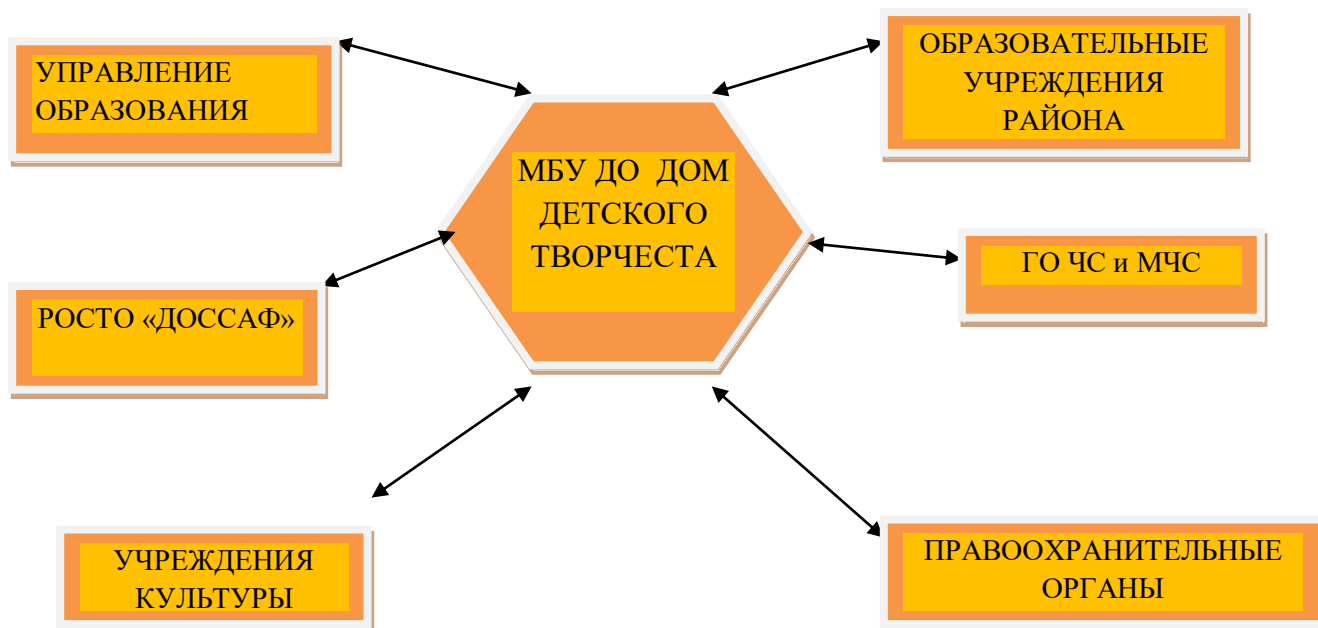
Схема взаимодействия с ведомствами:

Современное учреждение дополнительного образования детей не может полноценно функционировать без взаимодействия с другими учреждениями и ведомствами.