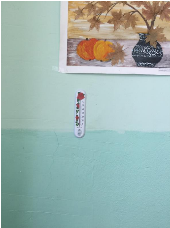
фото № 5