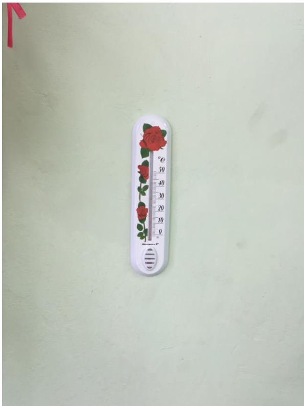
фото № 7