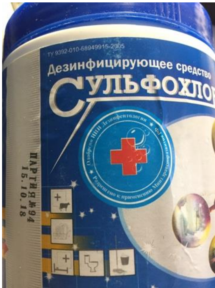
Фото № 9