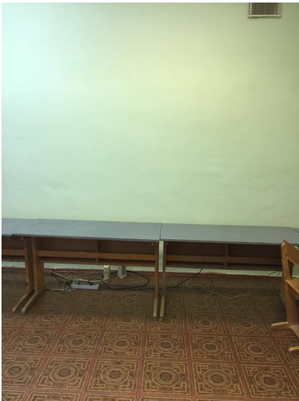
фото № 3