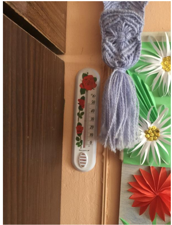
фото № 6