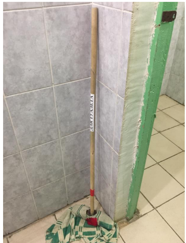
фото № 4