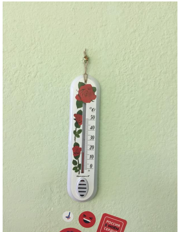
фото № 8