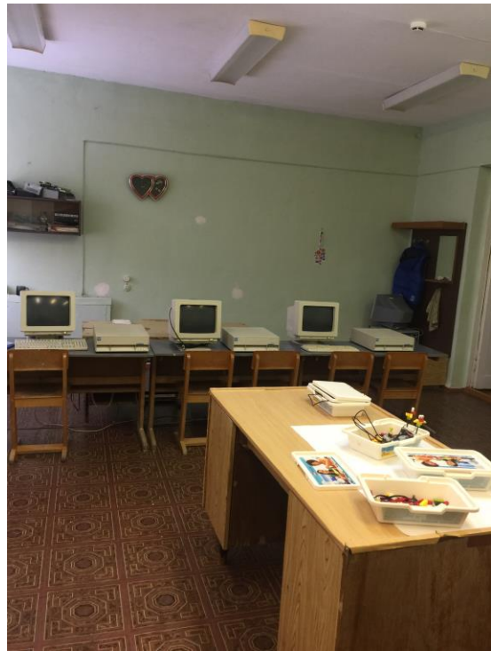
фото № 2